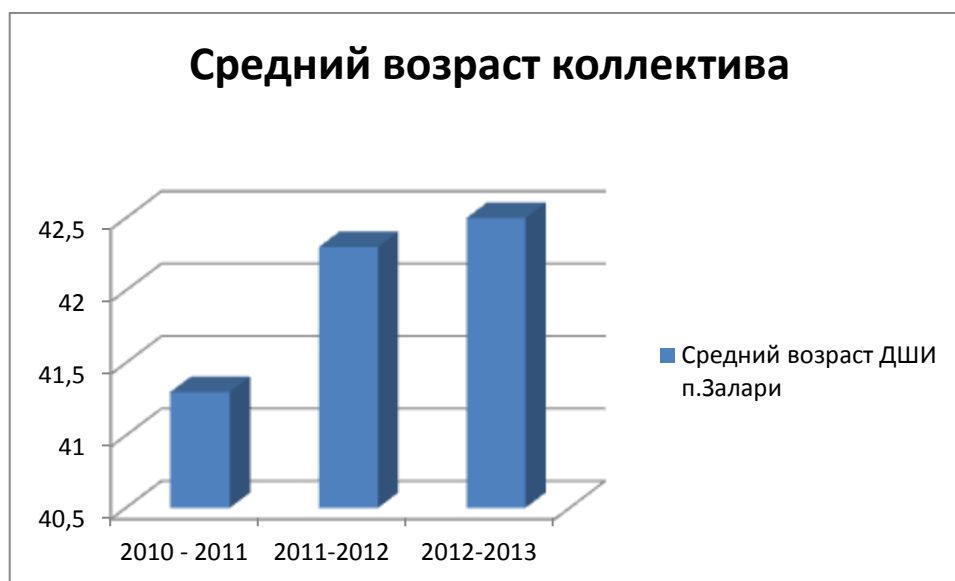
Состав кадров образовательного учреждения на 01.09.2013